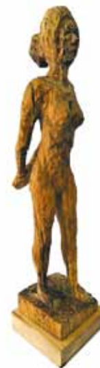
Rudolf Novak, Slovenija, les