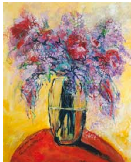
Dubravka Mijatović, Hrvaška, akril