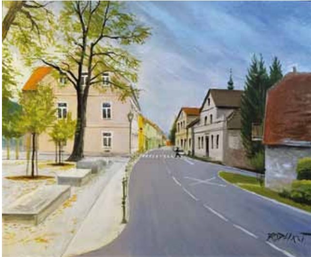
Ivo Brodej, Slovenija, akril