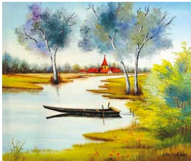
Željko Štefiček, Hrvaška, olje