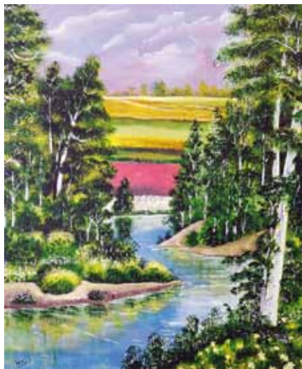
Ivo As, Slovenija, akril