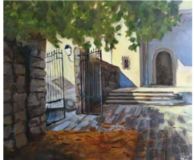
Zala Meklav, Slovenija, akril