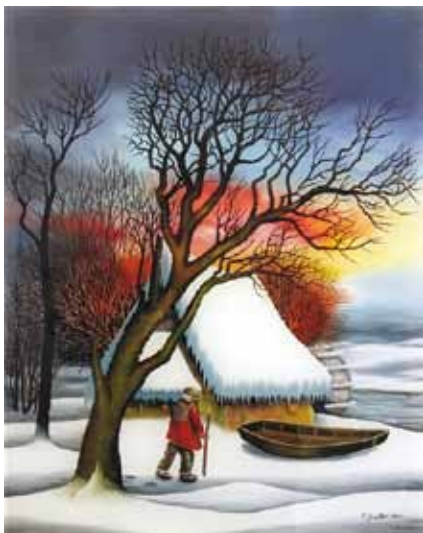
Tomislav Grabar, Hrvaška, olje na steklo