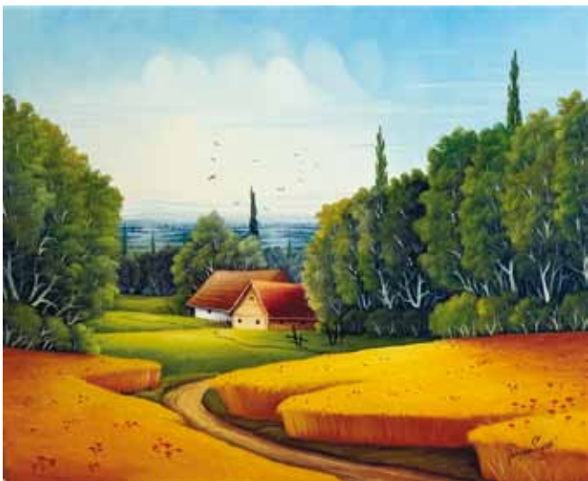
Stjepan Pongrac, Hrvaška, olje