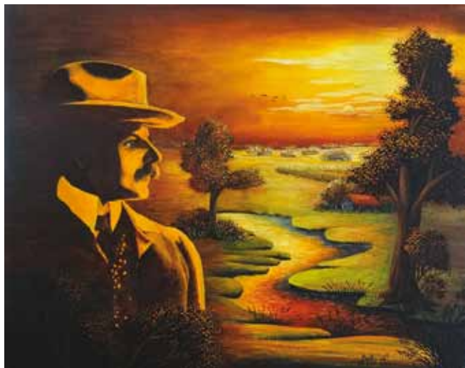
Nadica Belec, Hrvaška, olje