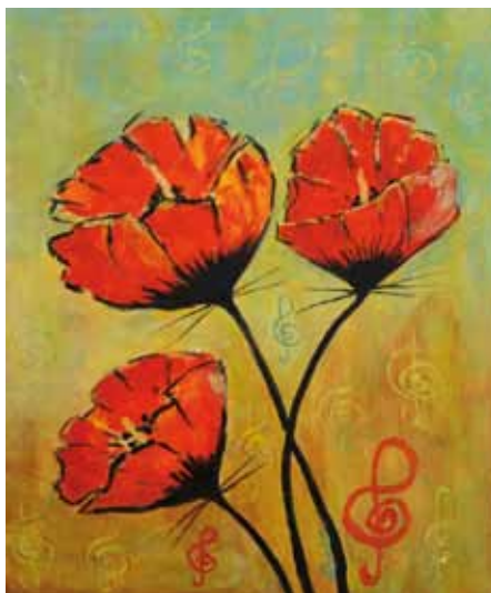
Binca Lomšek, Slovenija, akril