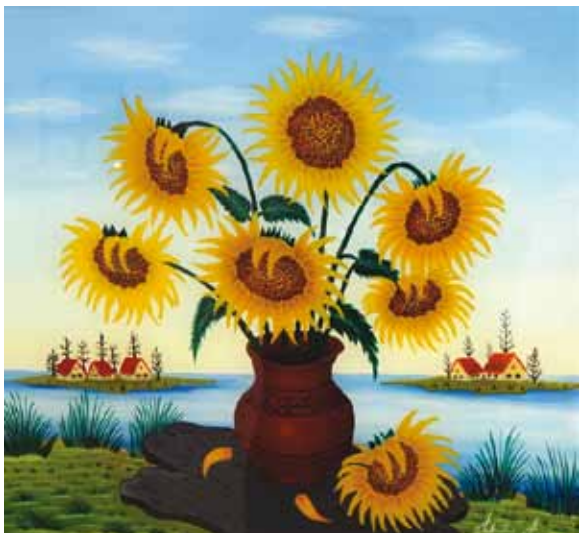
Stjepan Sekulić, Hrvaška, olje na steklo