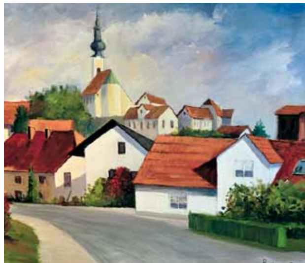
Dragan Podovac, Slovenija, akril