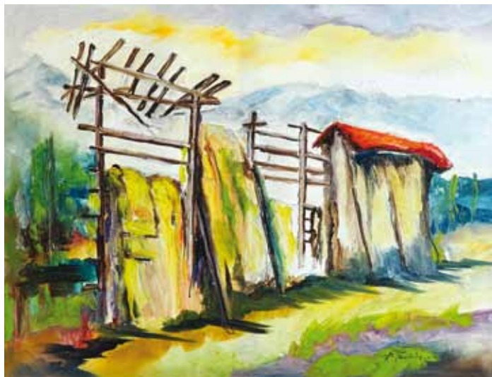
Ksenija Talijančić, Hrvaška, olje