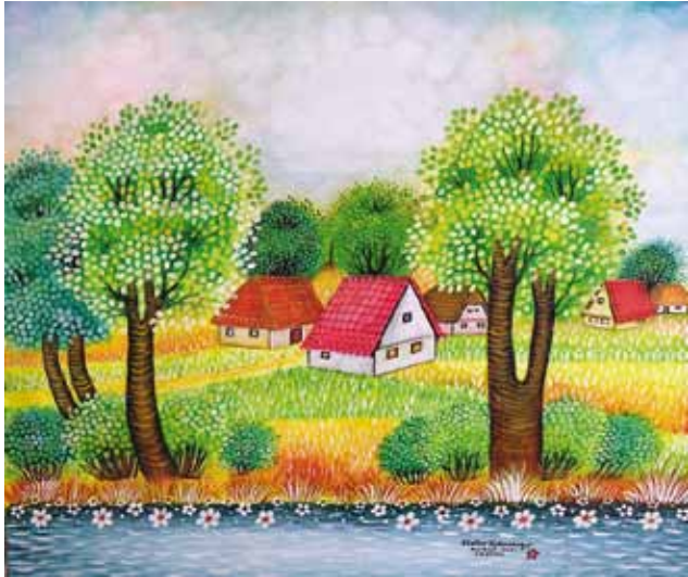
Zlatko Kolarek, Hrvaška, olje