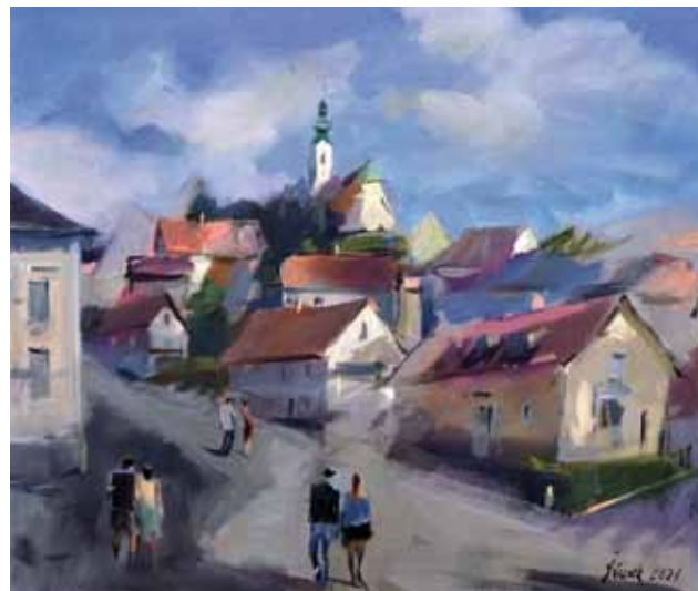
Božidar Ščurek, Slovenija, akril