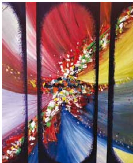
Marinka As, Slovenija, akril