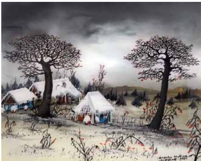
Branko Matina, Hrvaška, olje na steklo