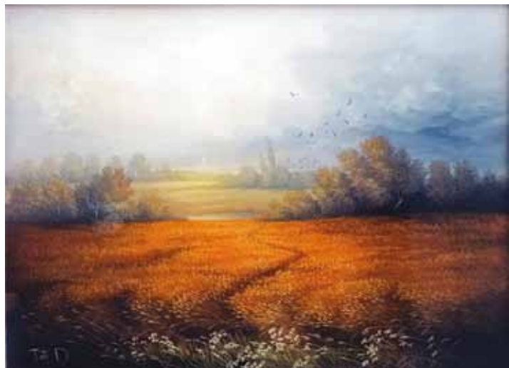
Denis Toth, Hrvaška, olje na steklo